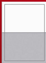
½ PÁGINA HORIZONTAL 165 mm x 240 mm